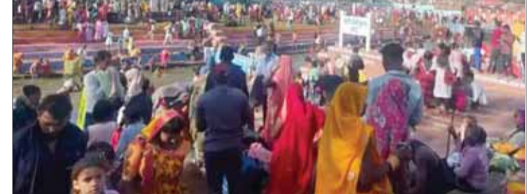
इस अमावस्या का विशेष महत्व है। उन्होंने कहा कि पीपल के वृक्ष के मूल में ब्रह्मा, त्वचा विष्णु, शाखा में शिव तथा सभी पतों में देवताओं का वास होता है। इसलिए पीपल वृक्ष की पूजा करने से सभी दुखों का नाश होता है तथा सभी सुख प्राप्त होते हैं। शहर सहित सभी प्रखंडों व गांवों में महिलाओं ने श्रद्धा भाव से पीपल वृक्ष की पूजा अर्चना किया। सोमवती अमावस्या के दिन सुबह से ही नर्मदा नदी के घाटों पर श्रद्धालुओं की भीड़ उमड़ी। इस दौरान श्रद्धालुओं ने मां नर्मदा सरोवर में डुबकी लगाकर माता नर्मदा का पूजन अर्चना किया। मान्यता है कि इस दिन नर्मदा नदी में डुबकी लगाने से कष्ट दूर हो जाते हैं। सोमवती अमावस्या के दिन स्नान, दान, और पितृ पूजन किया जाता है। इस दिन कुछ उपाय करने से पितृ दोष से मुक्ति मिलती है और पितरों का आशीर्वाद भी प्राप्त होता है। शास्त्रों के मुताबिक, सोमवती अमावस्या के दिन तामसिक भोजन का सेवन नहीं करना चाहिए, मांस-मदिरा और लहसुन और प्याज नहीं खाना चाहिए, घर में किसी भी तरह का वाद-विवाद नहीं होना चाहिए, किसी ईंसान के प्रति मन में गलत विचार नहीं लाने चाहिए।

जिले के विभिन्न क्षेत्रों में सोमवार को सोमवती अमावस्या को लेकर व्रती महिलाओं ने पीपल वृक्ष की पूजा अर्चना की तथा अपने पति की लंबी आयु व परिवार के सुख समृद्धि की कामना की। सोमवती अमावस्या को लेकर विभिन्न जगहों पर पीपल के पेड़ के नीचे व्रती महिलाओं की भीड़ लगी रही। व्रती महिलाओं ने सुबह स्नान आदि से निवृत्त होकर अपने आस-पड़ोस के पीपल के पेड़ के नीचे पूजा-अर्चना करने के लिए पहुंची।