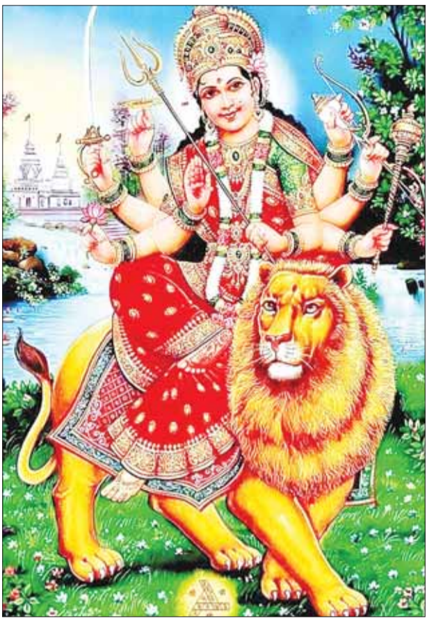
है ताकि इसकी ऊर्जा अपने अंदर समाहित कर सकें जब आसन पर बैठकर पाठ करना होता है। अगर हो सके तो मिट्टी के दीप में गाय के घी का दीपक जलाए जब तक जलते रहे तब तक पाठ करना चाहिए।