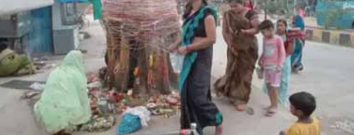
जिले के विभिन्न क्षेत्रों में सोमवार को सोमवती अमावस्या को लेकर व्रती महिलाओं ने पीपल वृक्ष की पूजा अर्चना की तथा अपने पति की लंबी आयु व परिवार के सुख समृद्धि की कामना की। सोमवती अमावस्या को लेकर विभिन्न जगहों पर पीपल के पेड़ के नीचे व्रती महिलाओं की भीड़ लगी रही। व्रती महिलाओं ने सुबह स्नान आदि से निवृत्त होकर अपने आस-पड़ोस के पीपल के पेड़ के नीचे पूजा-अर्चना करने के लिए पहुंची।